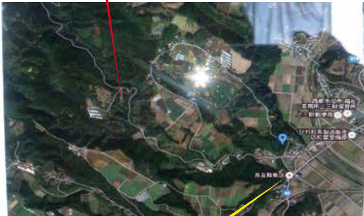
田舎堂・長友鮮魚店

看板のところを左折してください。 右手に田地区の公民館があります。 細い坂道をそのまま道なりに進んでください。